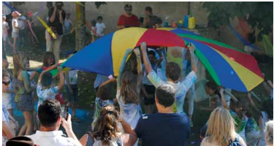
► OMSCA : Fête du Village, 18 juin 2017