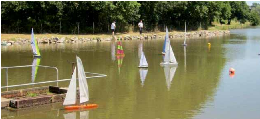
► Mini Nautic : Régate de voiliers sur l'étang de Moulin-Sault 11 juin 2017