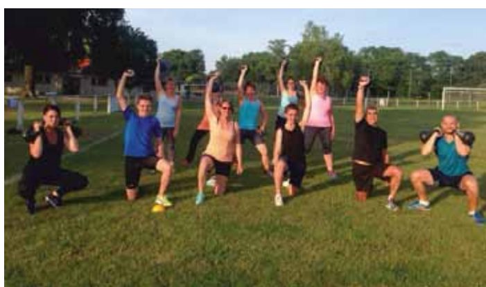
➤ Gym Arthonic varie ses activités avec le cross-training