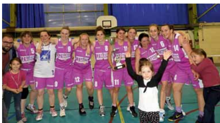
➤ Arthon Basket Club : victoire Coupe de l'Indre en Senior Filles