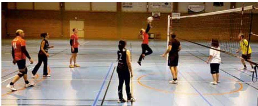
➤ Volley-Ball : l'équipe mixte en action