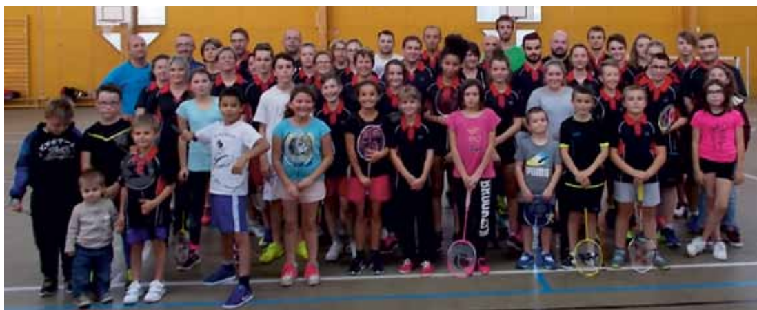
➤ Come One Arthon Badminton