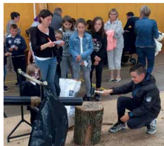
➤ APEA, kermesse fin juin 2017