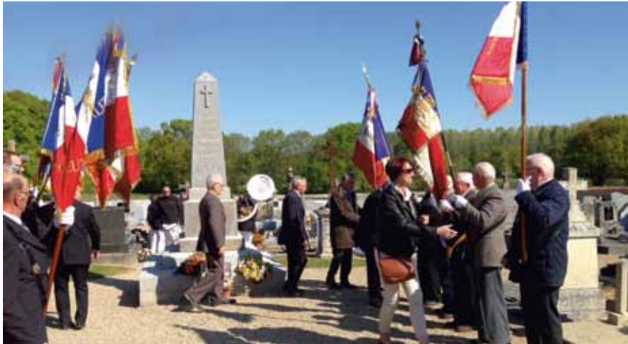
► Cérémonie du souvenir Français Velles-Arthon-Mosnay Avril 2017