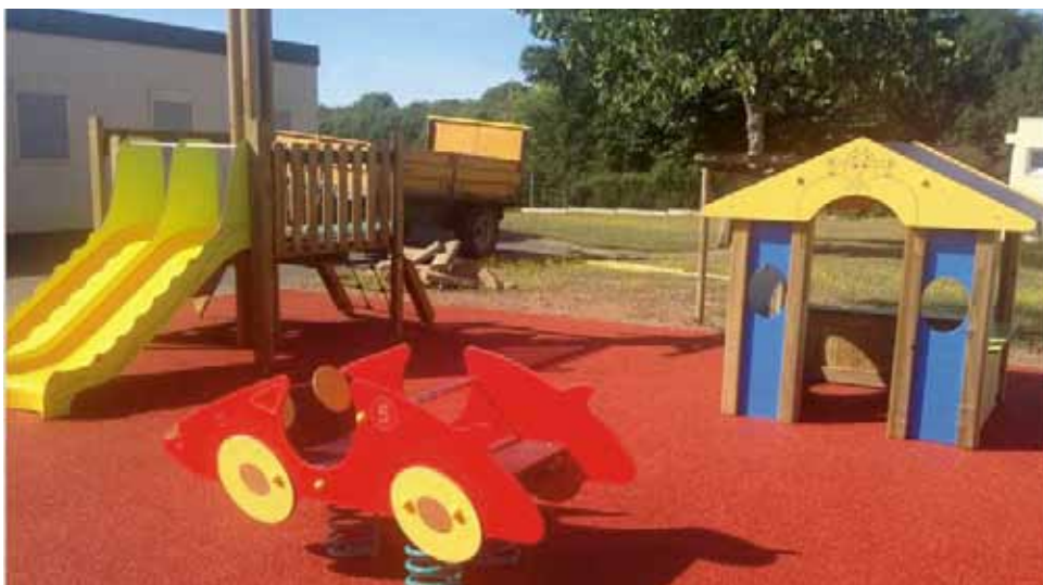
Les jeux de la Maternelle