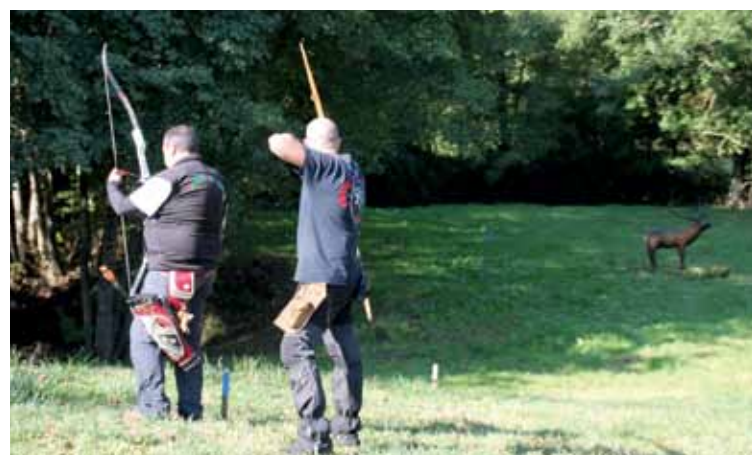
➤ Archers Club Arthonnais : 1er concours 3D qualificatif Championnat de France avec 63 compétiteurs