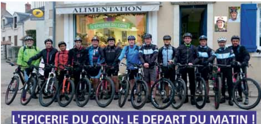
► Arthon randonnées